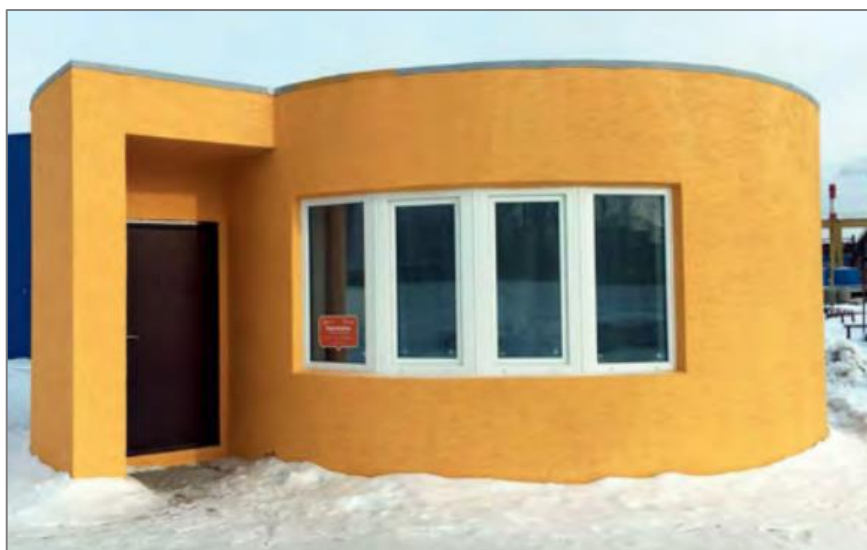
Рис. 6. Дом российской компании Apis Cor 2 . Fig. 6. House of the Russian company Apis Cor

В 2017 году уже российская компания Apis Cor впервые представила здание, площадью 37 метров квадратных. Объект был полностью отпечатан на строительной площадке (рис. 6).