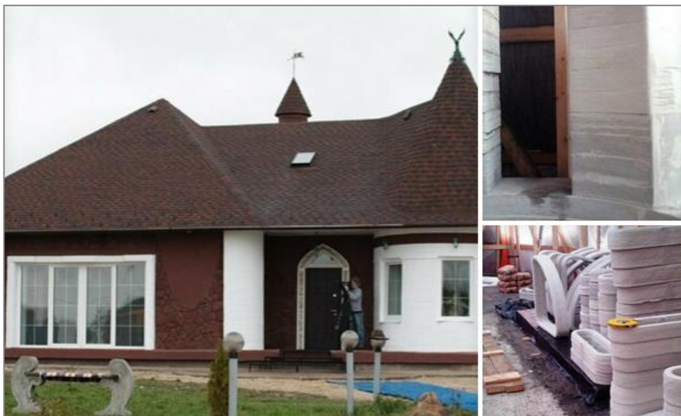
Рис. 7. Первый в Европе и СНГ жилой дом компании Спецавиа 3 Fig. 7. The first residential building of the Spetsavia company in Europe and the CIS

В октябре 2019 года этой же российской компанией было объявлено завершение строительства самого крупного в мире здания, площадью 650 метров квадратных, возведенного с помощью технологии 3D-печати (рис.8). Расположенное в Дубае и имеющее высоту 9,5 м здание было занесено в Книгу рекордов Гиннеса, как самое большое здание, отпечатанное на строительной площадке.