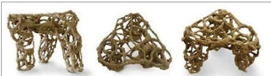
Рис. 3. Рабочие образцы группы П. Новикова, полученные методом компонентной склейки [3] Fig. 3. Working samples of P. Novikov's group, obtained by the method of component gluing

Таким образом, при реализации технологий спекания и напыления можно использовать солнечную энергию и обычный песок, что делает эти методы экологически безвредными. Но наиболее востребованной технологией аддитивного строительства является экструзионная печать зданий и инфраструктурных элементов благодаря способности создавать крупномасштабные строительные элементы сложных геометрических форм и применению традиционных строительных материалов.