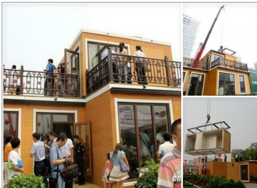
Рис. 5. Модульный двухэтажный дом компании Zhuoda 2 Fig. 5. Zhuoda modular two-storey house

Через год уже другая китайская компания Zhuoda построила модульный двухэтажный дом за рекордно короткий срок (рис. 5).