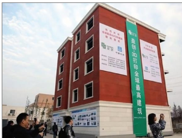
Рис. 4. Многоэтажный дом, напечатанный с помощью 3D-принтера компанией WinSun [1].

В течение десяти месяцев происходило усовершенствование технологий и после компания построила еще несколько зданий разного типа, самым высоким из которых был пятиэтажный дом (рис. 4).